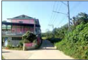
โครงการขยายเขตไฟฟ้าสาธารณะพร้อมติดตั้ง โคมไฟกิ่ง ซอย 10 หมู่ที่ 16 บ้านแม่กาห้วยเคียน