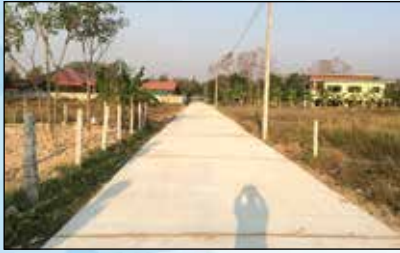
โครงการก่อสร้างถนนคอนกรีตเสริมเหล็ก (ค.ส.ล.) ในหมู่บ้านซอย 5, ซอย 8 หมู่ 11 บ้านแม่ตำบุงไยง