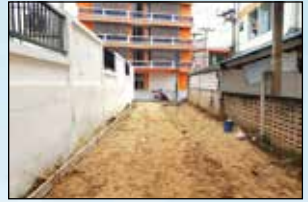
ถนน ค.ส.ล. ซอย 7 เชื่อม ซอย 8 หมู่ 2