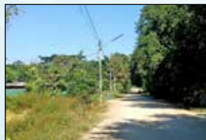
โครงการขยายเขตระบบจำหน่ายไฟฟ้าแรงต่ำ, ไฟฟ้าสาธารณะ ซอย 2 บ้านใหม่ หมู่ที่ 6