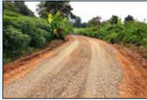
ถนนเข้าสู่พื้นที่การเกษตร หมู่ 1