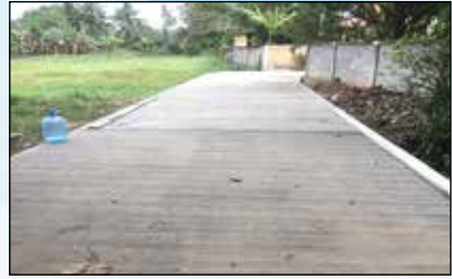
โครงการก่อสร้างถนนคอนกรีตเสริมเหล็ก (ค.ส.ล.) ภายในหมู่บ้าน หมู่ที่ 9 บ้านแม่ตำบุงไยง