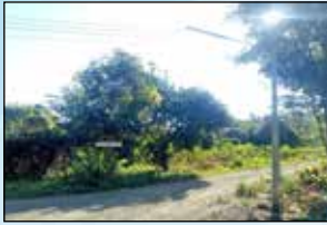
โครงการขยายเขตไฟฟ้าสาธารณะพร้อมติดตั้ง โคมไฟกิ่ง ซอย 2 หมู่ที่ 1 บ้านหม้อแกงทอง