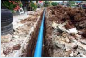
ขยายเขต น้ำประปา หมู่ 2