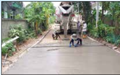
ถนน ค.ส.ล. ซอย 2 หมู่ 1