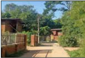
โครงการขยายเขตไฟฟ้าสาธารณะพร้อมติดตั้ง โคมไฟกิ่ง ซอย 9 หมู่ที่ 3 บ้านแม่กาหลวง