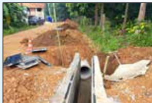
วางระบายน้ำ ซอย 3 หมู่ 16