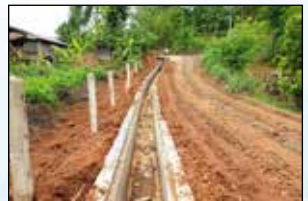
วางระบายน้ำ หมู่ 10