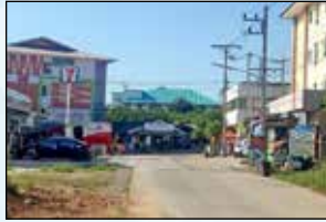
โครงการขยายเขตไฟฟ้าสาธารณะพร้อมติดตั้ง โคมไฟกิ่ง ซอย 6 หมู่ที่ 16 บ้านแม่กาห้วยเคียน