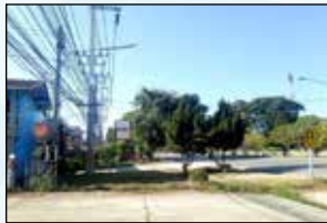
โครงการขยายเขตไฟฟ้าสาธารณะพร้อมติดตั้งโคมไฟกิ่ง บริเวณหน้าศูนย์เทรินป่าไม้แม่กา หมู่ที่ 16 บ้านแม่กาห้วยเคียน