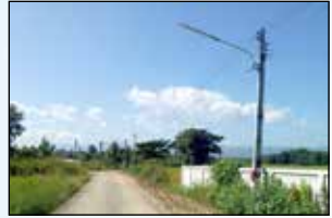
โครงการขยายเขตไฟฟ้าสาธารณะพร้อมติดตั้ง โคมไฟกิ่ง ซอย 7 หมู่ที่ 13 บ้านหนองแก้ว