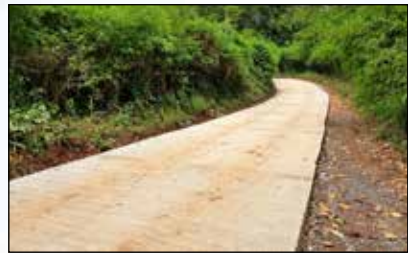
ถนน ค.ส.ล.หมู่ 18