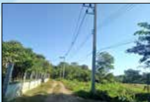
โครงการขยายเขตระบบจำหน่ายไฟฟ้าแรงต่ำ ซอย 3 หมู่ที่ 1 บ้านหม้อแกงทอง