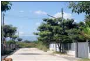
โครงการขยายเขตไฟฟ้าสาธารณะพร้อมติดตั้งโคมไฟกิ่ง บจก.เดอะริมน้ำไธเฮาส์ หมู่ที่ 8 บ้านแม่ตำบลบุญโยง