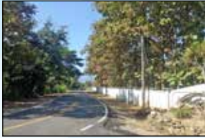
โครงการขยายเขตไฟฟ้าสาธารณะพร้อมติดตั้ง โคมไฟกิ่ง ซอย 5 หมู่ที่ 15 บ้านเกษตรสุข