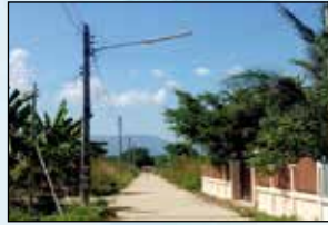
โครงการขยายเขตไฟฟ้าสาธารณะพร้อมติดตั้ง โคมไฟกิ่ง ซอย 5 หมู่ที่ 11 บ้านแม่ตำบลบุญโยง