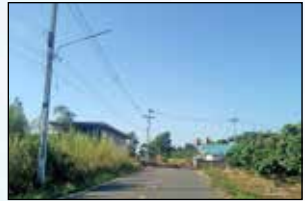
โครงการขยายเขตไฟฟ้าสาธารณะพร้อมติดตั้งโคมไฟกิ่ง ซอยประชาธรรมใจ บ้านดง-หลักหลวง หมู่ที่ 2 บ้านห้วยเคียน