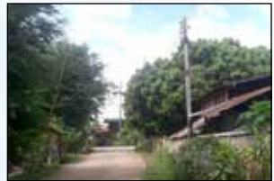
โครงการขยายเขตไฟฟ้าสาธารณะ พร้อมติดตั้งโคมไฟกิ่ง หมู่ที่ 6 บ้านแม่กาไร่